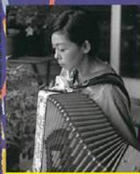
中山うり スペシャルバンド

※内容および詳細は、夜更となる場合がございます。 ※順延の場合、火まつりライブは中止となります。 【主催】直島の火まつり実行委員会 【後援】直島町・直島町教育委員会 【協賛】直島町内各企業等